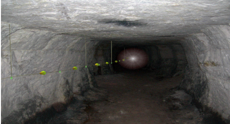
Şekil-1: Hayat hattı görünümü

18. (Ek:RG-10/3/2015-29291) (3) Yeraltı madenlerinde, hazırlık faaliyetlerinin yapıldığı alanlar ve üretim panoları gibi yeraltı maden işletmesinin bütün bölümlerini kapsayacak şekilde ve çalışanların yerüstüne çıkmalarını kolaylaştıran; yanmaya, kopmaya ve aşınmaya karşı dayanıklı bir hayat hattı kurulur (Şekil-1 ve Şekil-2). Bu hatlar acil durum planlarına uygun olarak yerleştirilir.